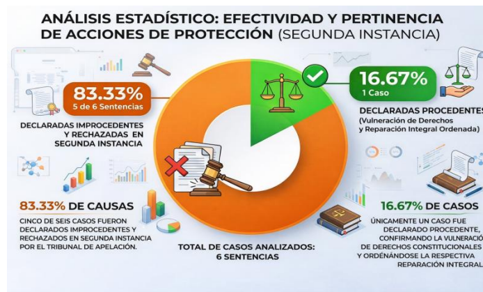
Figura 2. Efectividad y pertinencia de acciones de protección.

En todos estos escenarios, los jueces de alzada determinaron que los accionantes intentaron utilizar la vía constitucional como medio para eludir la justicia ordinaria y sus recursos propios, ya sea en materia contencioso-administrativa, laboral o civil, destacando la existencia de un único caso de procedencia correspondiente a la causa 06308-2019-00511 donde se analizó la vulneración al derecho de equidad de género.