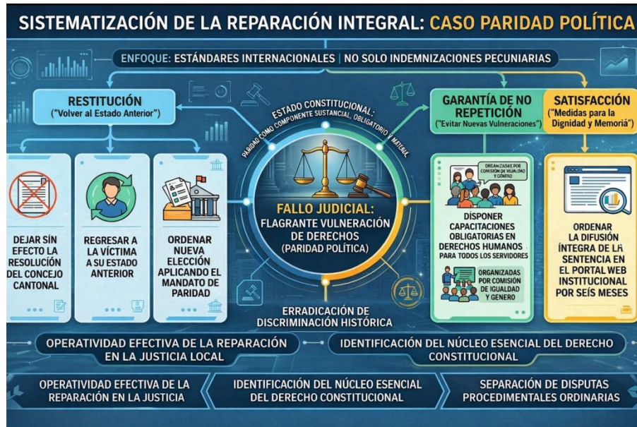
Figura 4. Reparación integral dentro de la causa 06308-2019-00511.

Descentralizado Municipal del cantón Guano. El problema jurídico planteado radicó en que, durante la sesión inaugural para la elección de la segunda autoridad del ejecutivo cantonal (Vicealcalde), en el subjudice se pudo determinar que el Concejo Cantonal inobservó el principio de paridad de género consagrado en los artículos 65 y 66 de la Constitución, así como en el Código Orgánico de Organización Territorial, Autonomía y Descentralización (COOTAD), al elegir a un hombre como vicealcalde existiendo mujeres en el cuerpo edilicio, se determinó la vulneración al derecho a la igualdad material y al derecho a la seguridad jurídica de una concejala.