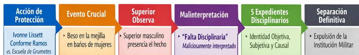
Figura 1. Sistematización de plataforma fáctica del hecho vulnerador del derecho.

El caso de estudio inicia con la acción de protección interpuesta por Ivonne Lissett Conforme Ramos en contra de la Escuela de Grumetes Contraamaestre Juan Suárez. La accionante plantea su reclamo jurisdiccional para proteger sus derechos indicando que la entidad accionada vulneró sus derechos constitucionales mediante la instauración de procedimientos disciplinarios arbitrarios, producto de un evento crucial ocasionado cuando la accionante besó a una compañera en la mejilla dentro de los baños de mujeres de la institución militar, este acto, fue presenciado por un superior de sexo masculino y malinterpretado maliciosamente como una falta disciplinaria que dio paso a la apertura de cinco expedientes disciplinarios, todos con identidad objetiva, subjetiva y casual, mismos que desencadenaron en la separación definitiva de la estudiante de la institución militar.