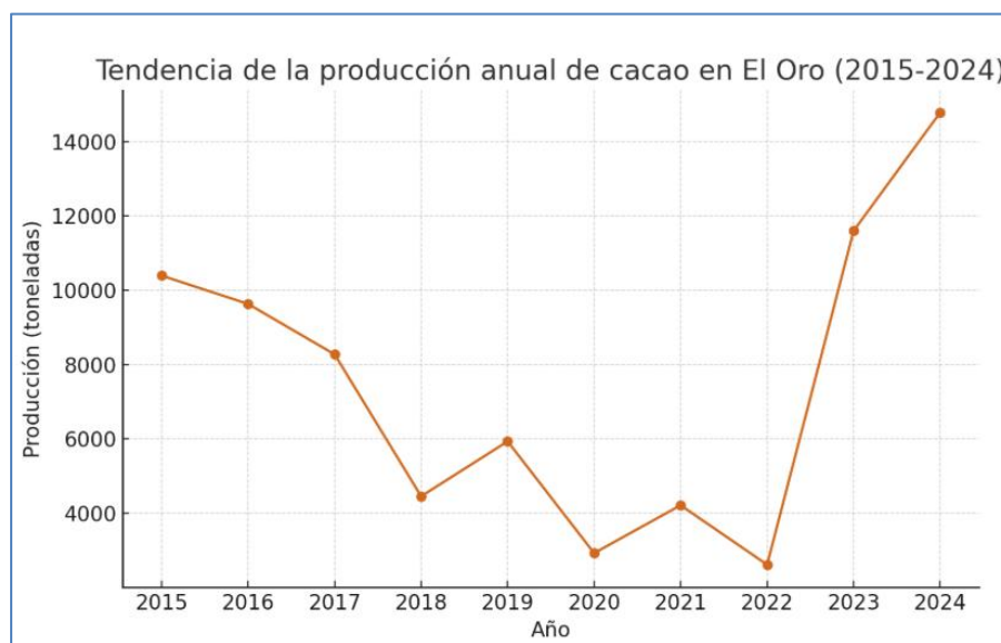
Figura 1. Tendencia de la producción anual de cacao 2015-2024.

Una vez organizada la información, se realizó el análisis exploratorio de los datos, elaborando gráficos de tendencia y calculando las tasas de crecimiento anual para evaluar el comportamiento general de la producción