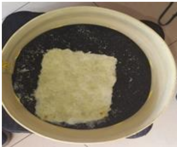
Figura 3: Obtención de papel utilizando cogollo de piña

La lignina es un polímero de naturaleza aromática con alto peso molecular que tiene como base estructural fenil-propano. Esta sustancia es la que da dureza y resistencia a las paredes celulares de las plantas; por lo que es necesario extraerla para poder obtener la celulosa. Ya para separar la lignina, se cocinan los trozos del cogollo y cascara previamente seccionados y cortados.