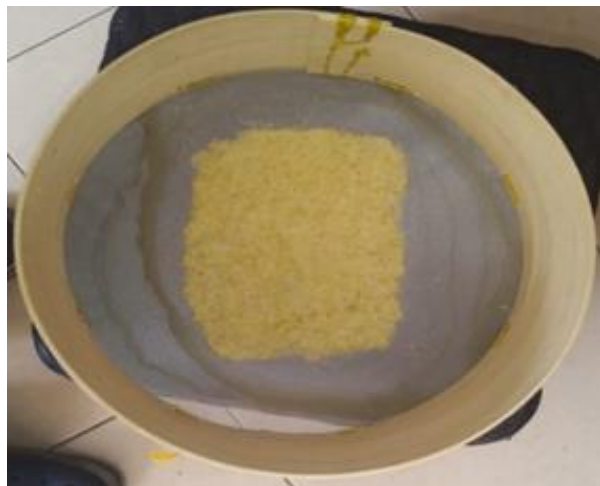
Figura 2: Obtención de papel utilizando la cascara de piña

Como la resina es impermeable, el papel resultante también debería tener ciertas propiedades de repelencia de agua. En el caso de los resultados que obtuvimos con la elaboración de la cascara, se obtuvo un papel menos efectivo en relación con la (resistencia al paso del tiempo), es decir presento menos resistencia al factor del tiempo y humedad, de esto podemos decir que el factor clave para la elaboración de papel en los tratamientos dependerá de la calidad de la materia prima utilizada.