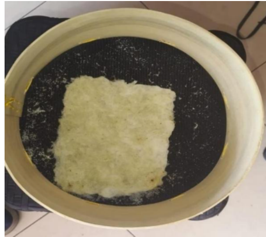
Figura 2. Obtención de papel utilizando el cogollo de piña

La lignina es un polímero de naturaleza aromática con alto peso molecular que tiene como base estructural fenil-propano. Esta sustancia es la que da dureza y resistencia a las paredes celulares de las plantas; por lo que es necesario extraerla para poder obtener la celulosa.