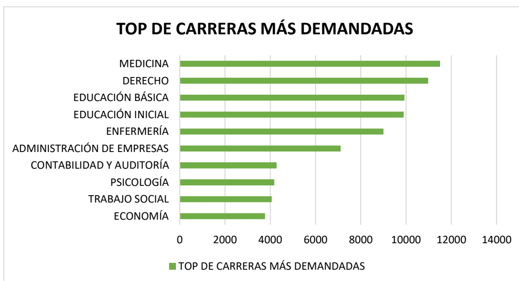
Figura 3: Top de carreras más demandadas en Ecuador.

Las tendencias en la elección de carrera de los estudiantes ecuatorianos y puede ser útil para orientar a los jóvenes en su proceso de toma de decisiones. Sin embargo, es importante tener en cuenta que la demanda de carreras puede variar con el tiempo y estar influenciada por factores como los cambios en el mercado laboral, las políticas gubernamentales y las tendencias sociales. En la Figura 3, se muestra el top de las carreras y la demanda.